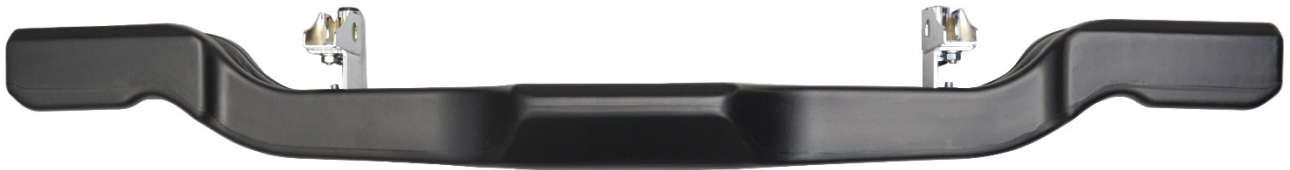
Photo vue de côté avec supports / Photo from the side with supports